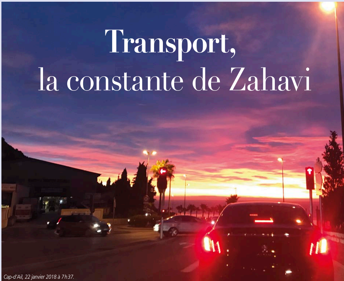
Cap-d'Ail, 22 janvier 2018 à 7h37.